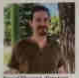
Portrait of a man, likely the author or a key figure in the article.

Le spectacle « La nuit des Temps » est un spectacle vivant qui raconte l'histoire de la région rhodanienne de 2000 ans avant Jésus-Christ à nos jours. Il est organisé par la Guilde de l'Histoire et se déroule au théâtre de la Guilde à Cornillon.