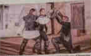
Le spectacle « La nuit des Temps » de la 2e page à 17h 30 au théâtre de la Guilde

Le spectacle « La nuit des Temps » est un spectacle vivant qui raconte l'histoire de la région rhodanienne de 2000 ans avant Jésus-Christ à nos jours. Il est organisé par la Guilde de l'Histoire et se déroule au théâtre de la Guilde à Cornillon.