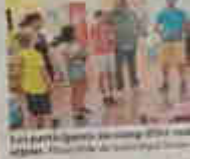
Le RubisCube attire une bonne foule - photo par André de la 2e page à 17h 30 au théâtre de la Guilde

Le RubisCube attire une bonne foule. Les participants ont apprécié l'activité et ont pu découvrir de nouvelles choses.